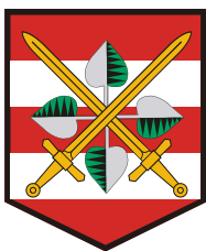
KRAJSKÉ ŘEDITELSTVÍ POLICIE JIHOMORAVSKÉHO KRAJE